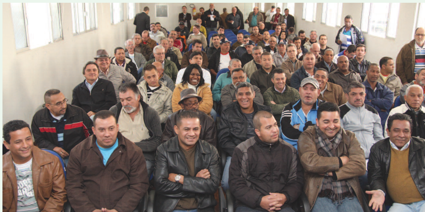
UNIÃO: Representantes de sindicatos de todo o Estado de São Paulo se reuniram na Federação para organizar o grande ato público de 3 de agosto

RESPONSÁVEL: A DIRETORIA ANO XIX NÚMERO 224 JULHO DE 2011